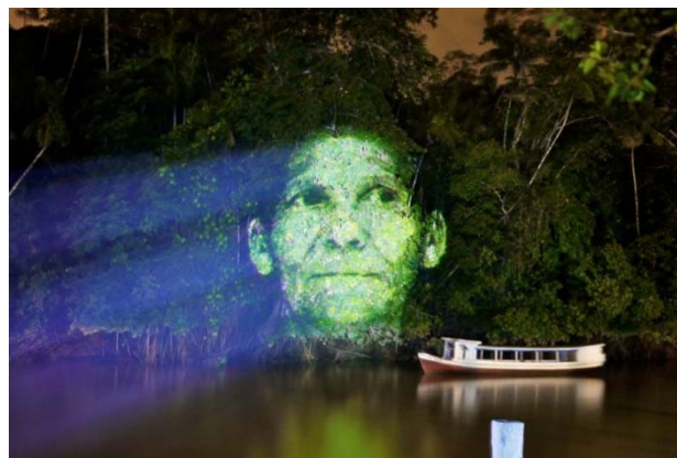
Roberta Carvalho, Symbiosis, 2007, projeção de vídeo digital, em paisagem amazônica da Ilha do Combú.

No projeto Symbiosis , a artista plástica paraense Roberta Carvalho recria imagens de homens e mulheres amazônicos projetando fotos e vídeos sobre a vegetação.