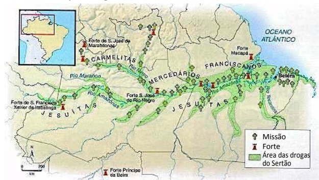
Mapa da ocupação da Amazônia entre os séculos XVI e XVIII.

A respeito dos objetivos da conquista político-religiosa do vale do Amazonas, no período colonial, pelos portugueses, assinale V para a afirmativa verdadeira e F para a falsa.