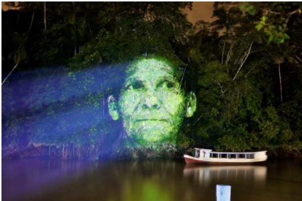
Roberta Carvalho, Symbiosis , 2007, projeção de vídeo digital, em paisagem amazônica da Ilha do Combú.

No projeto Symbiosis , a artista plástica paraense Roberta Carvalho recria imagens de homens e mulheres amazônicos projetando fotos e vídeos sobre a vegetação.