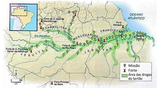
Mapa da ocupação da Amazônia entre os séculos XVI e XVIII.

A respeito dos objetivos da conquista político-religiosa do vale do Amazonas, no período colonial, pelos portugueses, assinale V para a afirmativa verdadeira e F para a falsa.