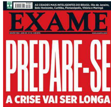
Fonte: Exame , de 5 de agosto de 2015.

O Brasil enfrentou uma forte crise econômica entre abril de 2014 e dezembro de 2016, e, ao longo desse período, ocorreu uma retração do Produto Interno Bruto (PIB).