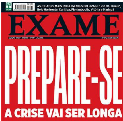
Fonte: Exame , de 5 de agosto de 2015.

O Brasil enfrentou uma forte crise econômica entre abril de 2014 e dezembro de 2016, e, ao longo desse período, ocorreu uma retração do Produto Interno Bruto (PIB).