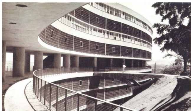
Imagem: Nabil Bonduki

O cobogó , invenção brasileira, é um elemento construtivo pré-fabricado, vazado, que proporciona ventilação natural aos ambientes. Foi criado em Pernambuco, em 1929, e se tornou um ícone da arquitetura moderna no Brasil.