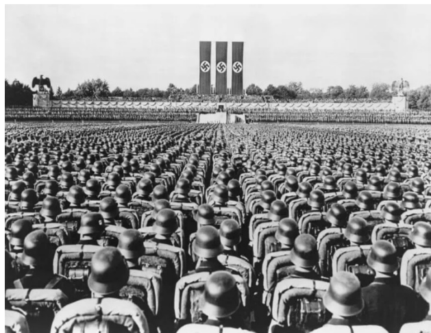
Reunião das tropas SA, SS e NSKK em um Congresso do Partido Nacional-Socialista Alemão, em Nuremberg (novembro de 1935).