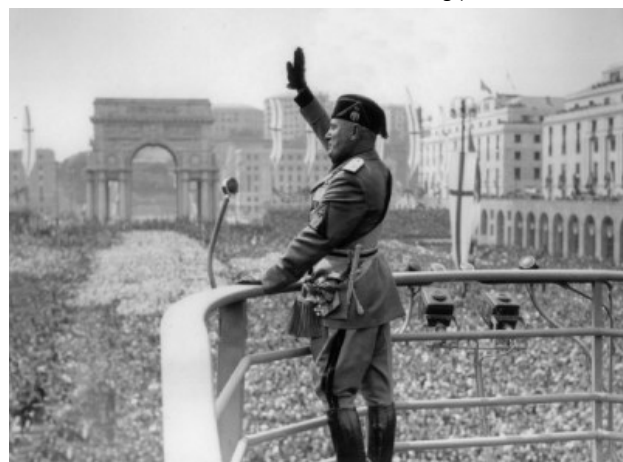
Mussolini discursa em Gênova na Praça da Vitória com o Arco da Vitória ao fundo, construído pelo regime fascista (maio de 1938).

Assinale a opção que apresenta a característica dos regimes nazifascistas, evidenciada em ambas as imagens.