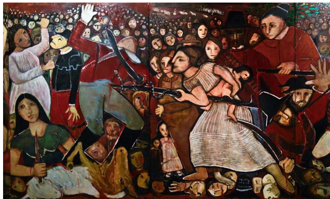
Detalhe do painel

O painel se inspira na Batalha de Tejucupapo (1646), que ficou famosa pela participação vitoriosa das mulheres daquele vilarejo na luta contra os holandeses.